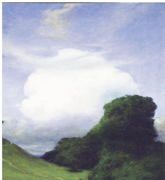
Molnet av prins Eugen