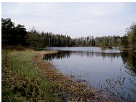
Rävnäset och sjön Fatburen

Medtag gärna fika! Vandring är kostnadsfri.