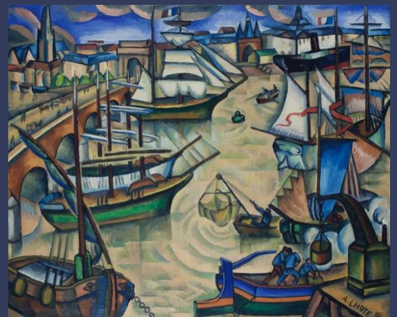
André Lhote, Hamnen i Bordeaux, 1912. Olja på duk, 106 x 131