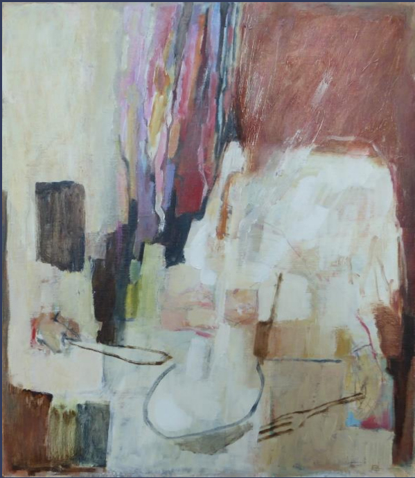
Eva Broma, En ängel vid mitt bord , olja på duk