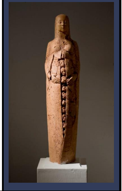
Skyddsmantelmadonnan © Lena Lervik

Anmäl dig senast den 19 maj () till inger.klasson@gmail.com