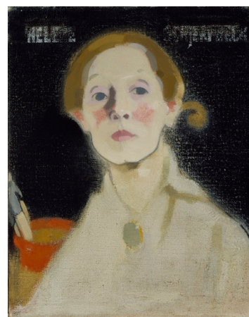
Självporträtt med svart fond av Helene Schjerfbeck