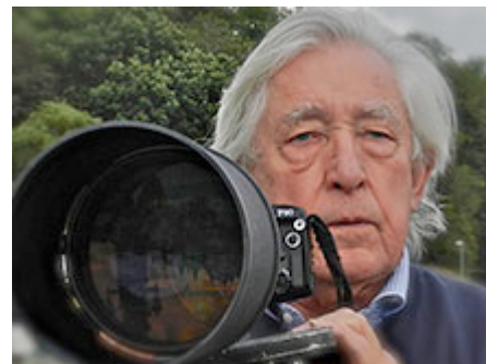
Hans Hammarskiöld med sin kamera